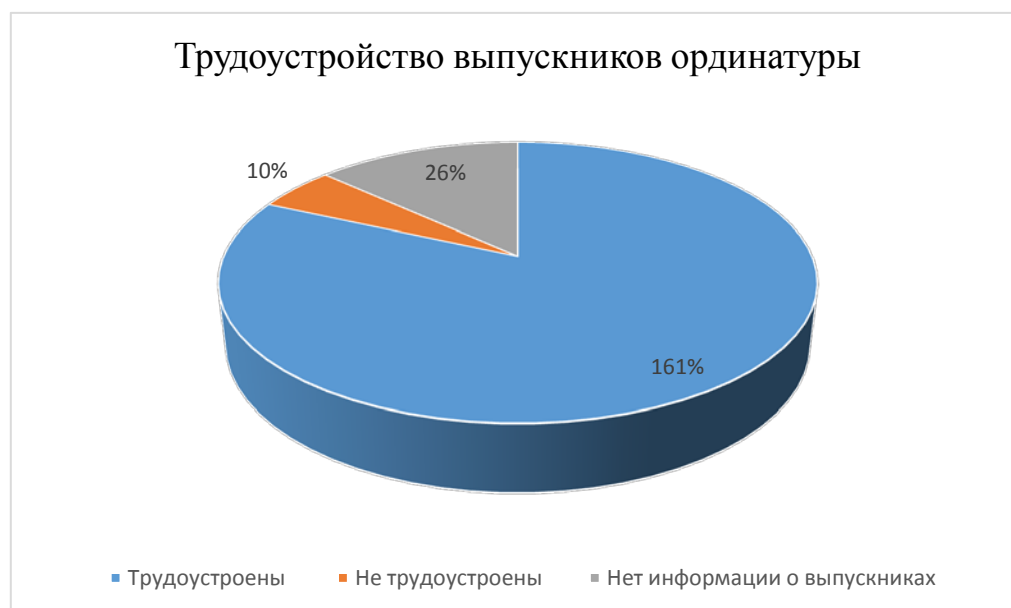
Рисунок 4 – Трудоустройство выпускников ординатуры

Из 197 ординаторов 2018 года выпуска трудоустроились 161 (81,7%), в основном в государственные и муниципальные учреждения здравоохранения г. Челябинска и Челябинской области. В коммерческие медицинские организации трудоустроились всего 23 человека (11,7%). Не трудоустроились 10 человек (5%), из них 4 выпускницы в связи с рождением ребенка и необходимостью ухода за ним. С 26 ординаторами (13,2%) данного года выпуска не удалось связаться.