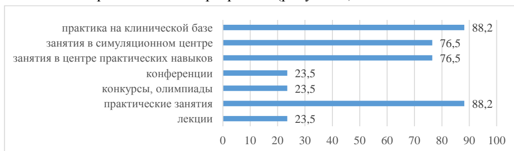
Рисунок 3 – Распределение мнения выпускников о наиболее важных составляющих образовательной программы

Результаты анкетирования показали, что выпускники четко осознают потенциальные возможности в контексте собственных притязаний в профессии. Выделены наиболее важные составляющие освоенной образовательной программы (рисунок 3).