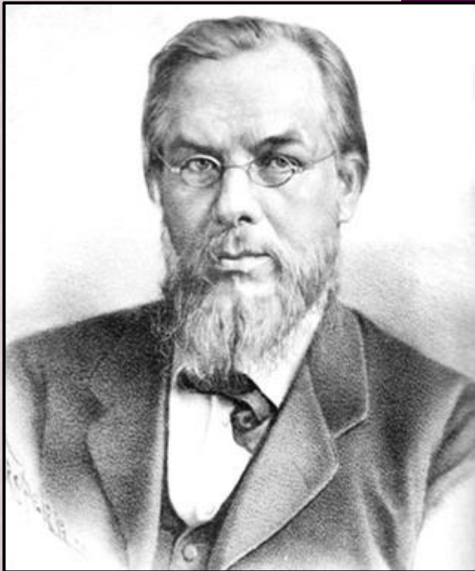
Боткин Сергей Петрович 1832 - 1889