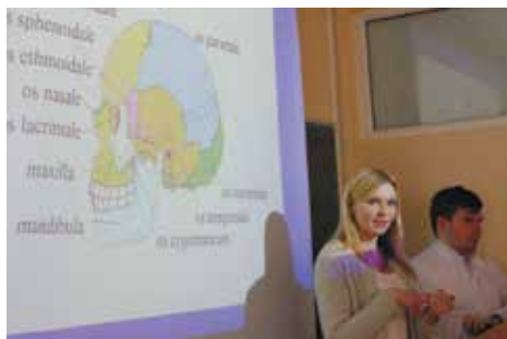
На областной конференции «Юный медик».

Занятия на курсах ведут преподаватели, среди которых авторитетные специалисты и ученые, имеющие многолетний опыт работы с абитуриентами.